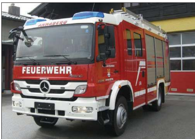
Taktische Bezeichnung: LFA Aufbaufirma: Seiwald