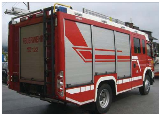
Fahrgestell: Mercedes 1329 AF Abnahme: 15.07.2014 bei der Firma Seiwald