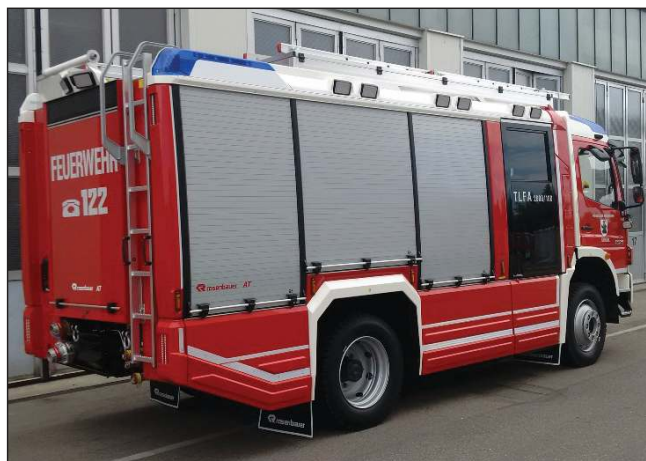
Fahrgestell: Mercedes Atego 1629 AF Abnahme: 01.07.2014 bei der Firma Rosenbauer