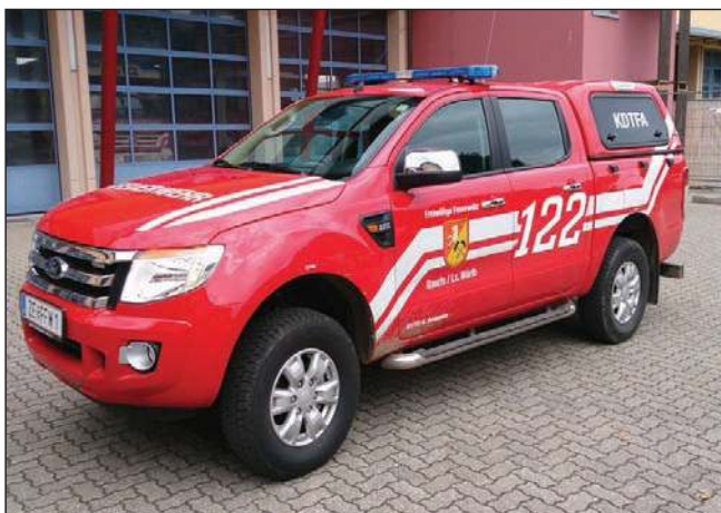
Taktische Bezeichnung: KDFA Aufbaufirma: Eigenbau