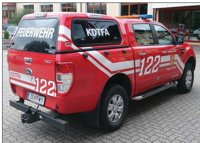
Fahrgestell: Ford Ranger Abnahme: 14.07.2014 beim LFV Salzburg