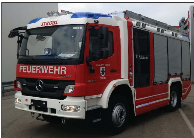
Taktische Bezeichnung: TLFA 2000 Aufbaufirma: Rosenbauer