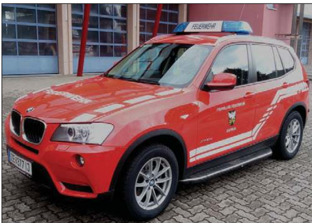
Taktische Bezeichnung: KDTFA Aufbaufirma: BMW Kaufmann