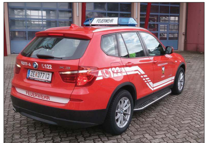
Fahrgestell: BMW X3 Abnahme: 21.08.2014 beim LFV Salzburg