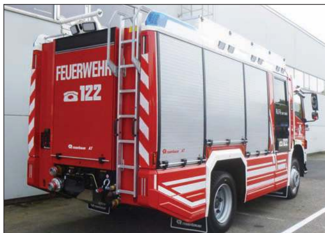
Fahrgestell: Mercedes Atego 1629 AF Abnahme: 13.10.2014 bei der Fa. Rosenbauer