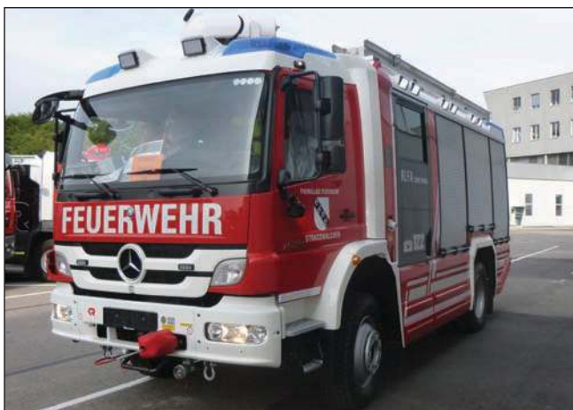
Taktische Bezeichnung: RLFA 2000 Tunnel Aufbaufirma: Rosenbauer