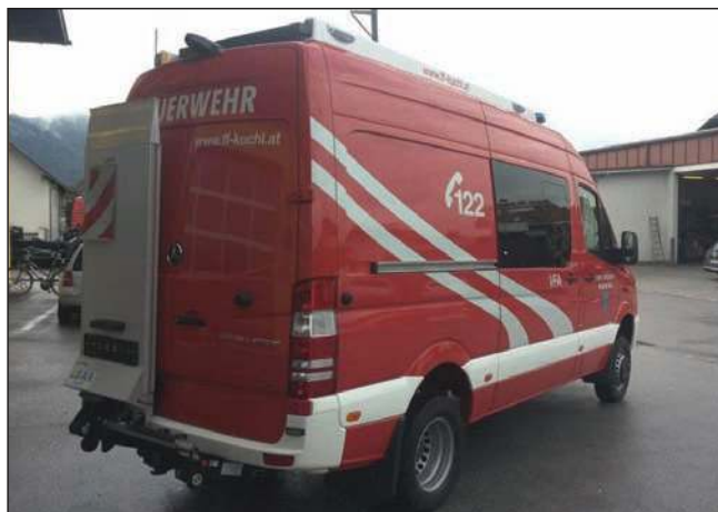
Fahrgestell: Mercedes Sprinter 519 CDI Abnahme: 03.10.2014 im LFV-Salzburg