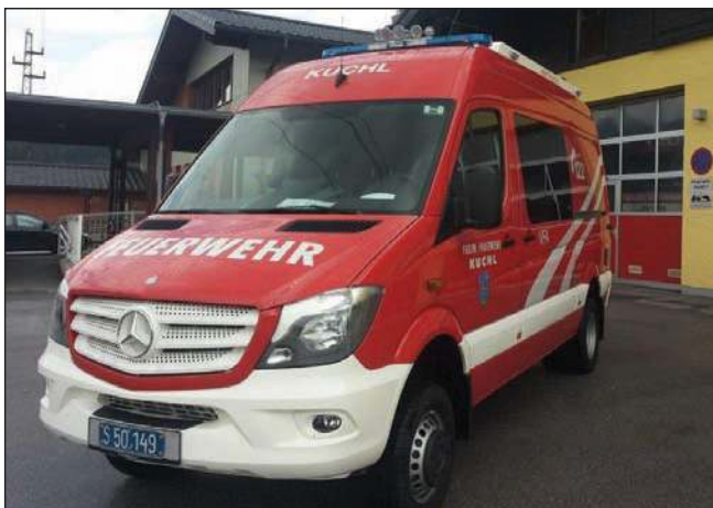
Taktische Bezeichnung: VFA Aufbaufirma: Seiwald