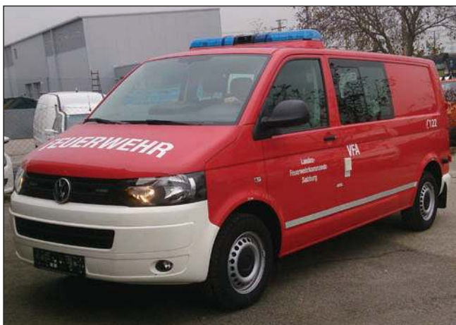
Taktische Bezeichnung: VFA Aufbaufirma: BBG und Fa. Porsche Wr. Neustadt