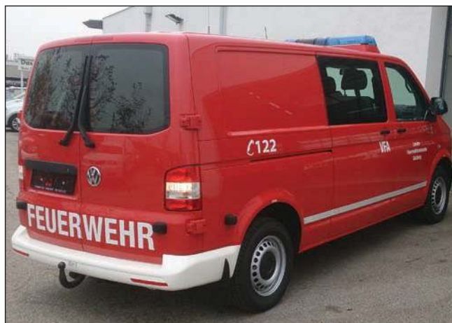
Fahrgestell: VW T5 Abnahme: 30.10.2014 bei der Fa. Porsche Wr. Neustadt