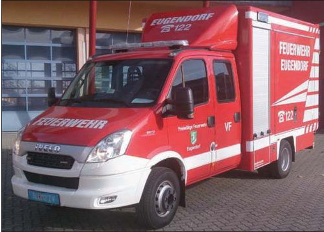
Taktische Bezeichnung: VF Aufbaufirma: Wuppinger