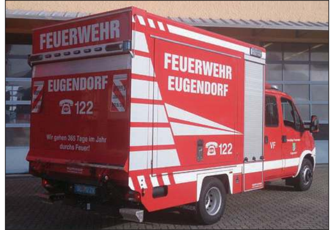
Fahrgestell: Iveco Daily 65C17LD Abnahme: 12.11.2014 im LFV Salzburg