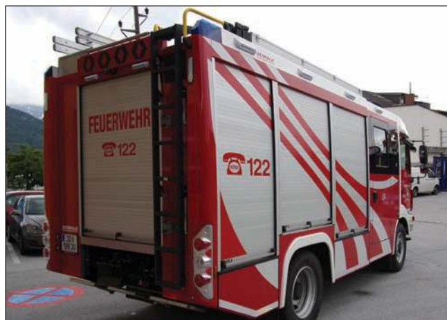
Fahrgestell: MAN 13.290 Abnahme: 20.05.2015 bei der Fa. Seiwald