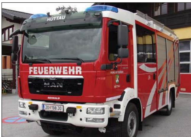
Taktische Bezeichnung: LFA Aufbaufirma: Fa. Seiwald