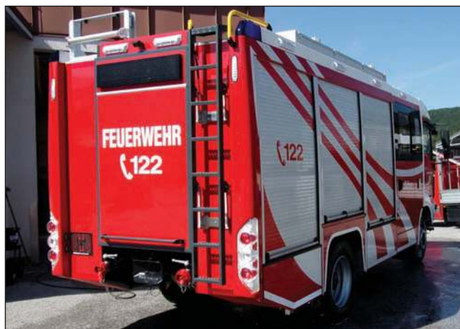
Fahrgestell: MAN 15.290 Abnahme: 20.05.2015 bei der Fa. Seiwald