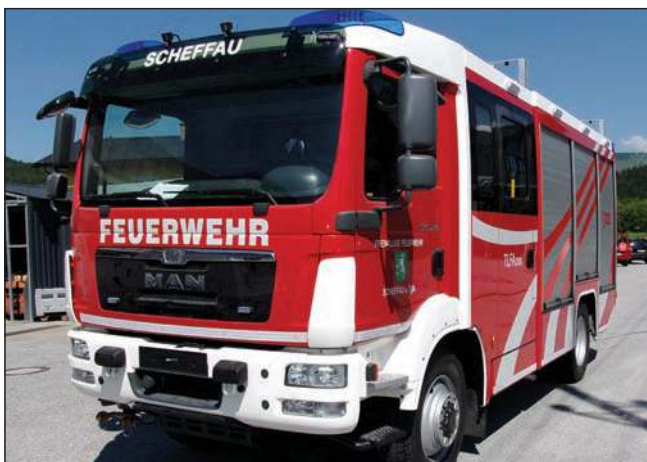
Taktische Bezeichnung: TLFA 2000 Aufbaufirma: Fa. Seiwald