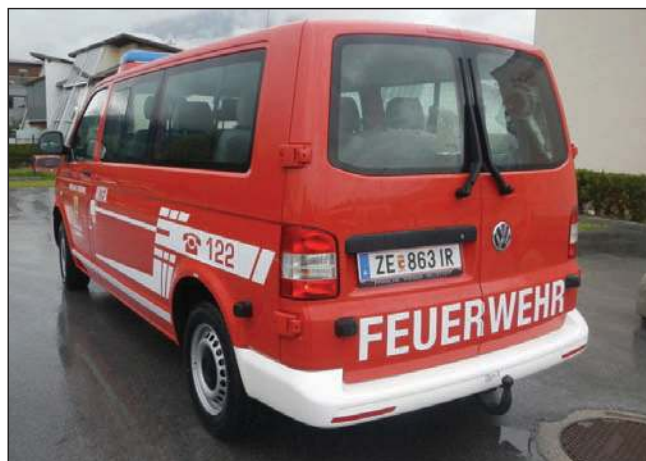
Fahrgestell: VW T5 Abnahme: 12.08.2015 beim LFV Salzburg