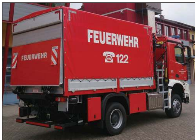
Fahrgestell: Mercedes-Benz Arox 1843 4x4 Abnahme: 19.08.2015 beim LFV Salzburg