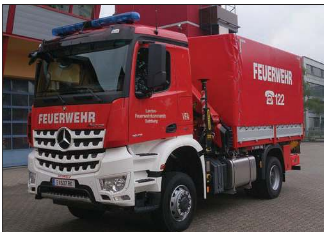
Taktische Bezeichnung: VFA Aufbaufirma: Schraml / Seiwald