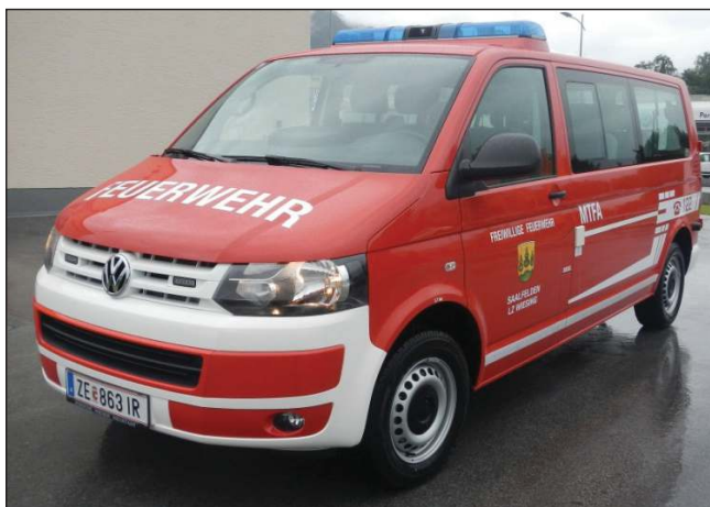
Taktische Bezeichnung: MTFA Aufbaufirma: BBG, Fa. Porsche Wr. Neustadt