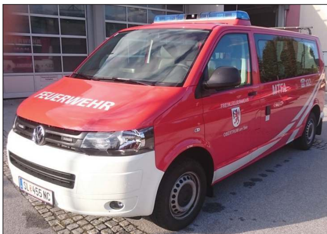
Taktische Bezeichnung: MTFA Aufbaufirma: VW Reibersdorfer