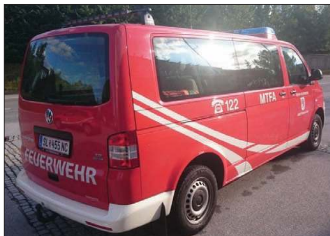
Fahrgestell: VW T5 Abnahme: 18.08.2015 beim LFV Salzburg