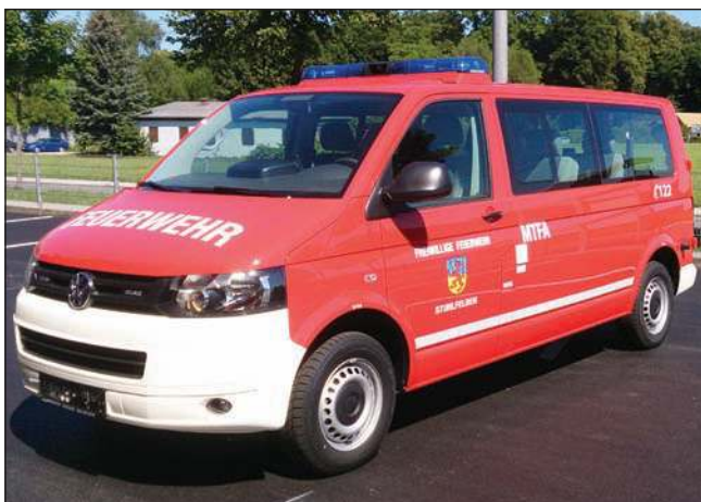
Taktische Bezeichnung: MTFA Aufbaufirma: BBG, Fa. Porsche Wr. Neustadt