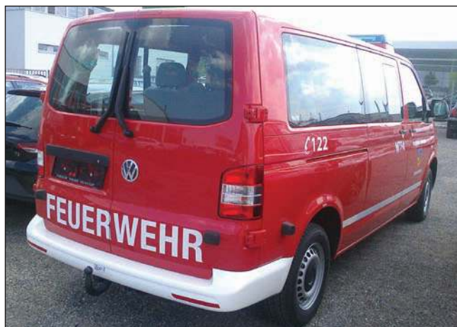
Fahrgestell: VW T5 Abnahme: 05.08.2015 beim LFV Salzburg