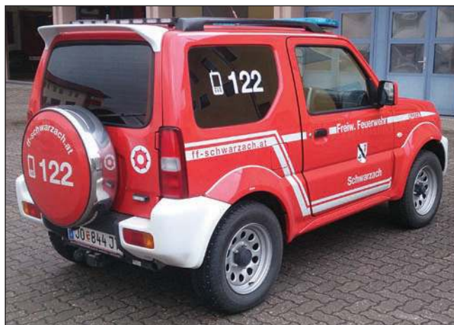
Fahrgestell: Suzuki Jimny Abnahme: 27.11.2015 im LFV Salzburg