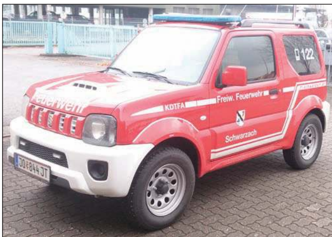
Taktische Bezeichnung: KDTFA Aufbaufirma: Eigenaufbau