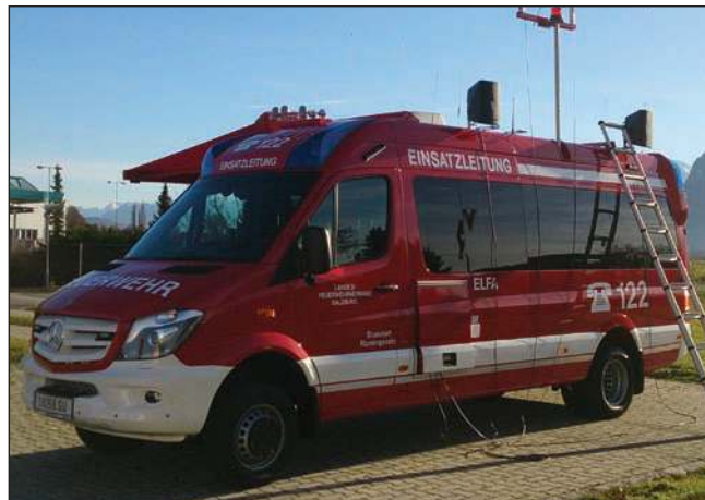
Fahrgestell: Mercedes Sprinter 519 CDI 4x4 Abnahme: 24.11.2015 bei der Fa. Dlouhy Tulln