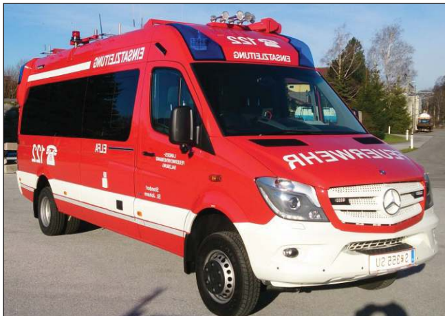
Taktische Bezeichnung: ELFA Aufbaufirma: Fa. Dlouhy