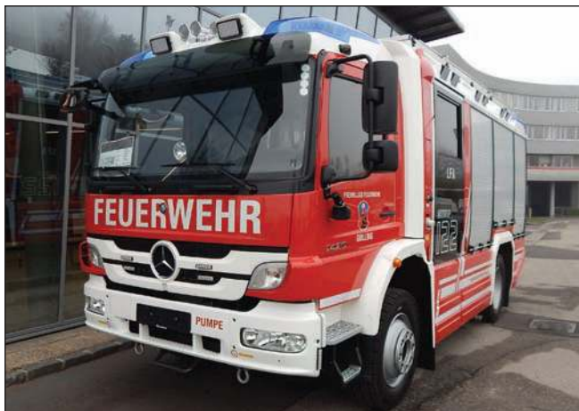
Taktische Bezeichnung: LFA Aufbaufirma: Rosenbauer