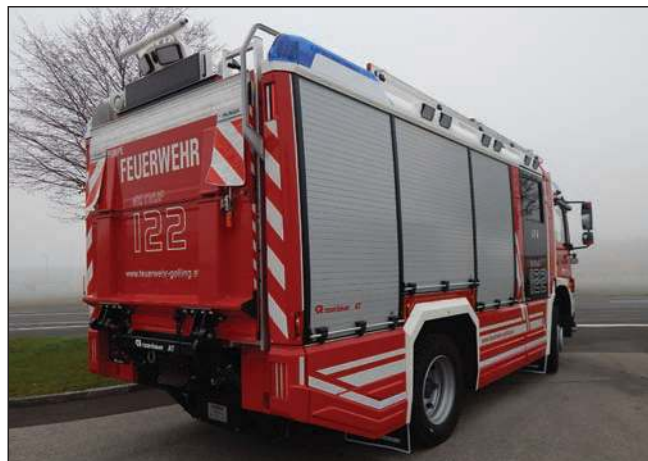
Fahrgestell: Mercedes 1429 A F Abnahme: 10.12.2015 bei der Fa. Rosenbauer