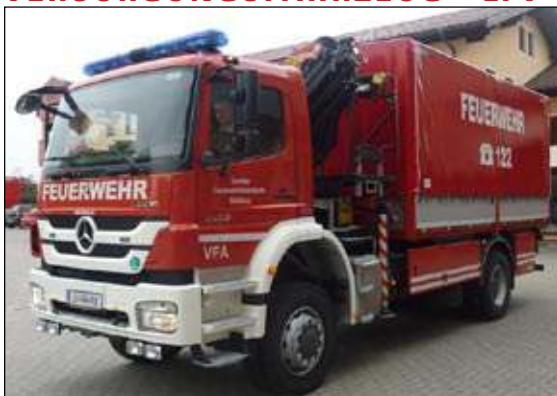
Taktische Bezeichnung: VF2A Aufbaufirma: Schramml / Seiwald