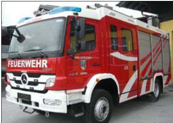
Taktische Bezeichnung: LFA Aufbaufirma: Seiwald