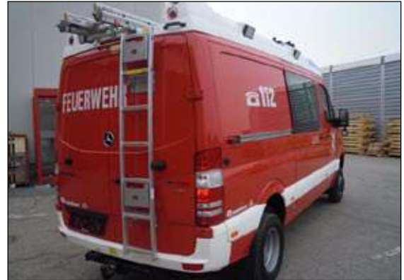
Fahrgestell: Mercedes Sprinter 519 CDI 4x4 Abnahme: 12.04.2013 beim LfV Salzburg