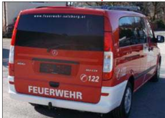
Fahrgestell: MB Vito Abnahme: 23.04.2013 beim LfV Salzburg