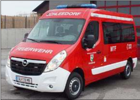
Taktische Bezeichnung: MTF Aufbaufirma: Lagermax