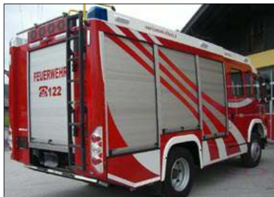
Fahrgestell: Mercedes Atego 1429 AF Abnahme: 19.04.2013 bei der Fa. Seiwald