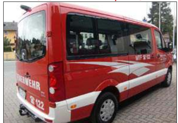
Fahrgestell: VW Crafter 35 Kombi TDI Abnahme: 18.04.2013 beim LfV Salzburg