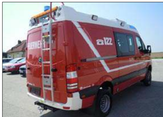
Fahrgestell: Mercedes Sprinter 519 CDI 4 x 4 Abnahme: 25.04.2013 bei der Fa. Rosenbauer