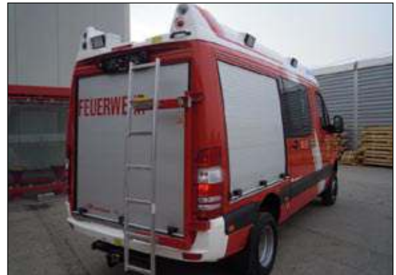
Fahrgestell: Mercedes Sprinter 519 CDI 4 x 4 Abnahme: 12.04.2013 beim LfV Salzburg