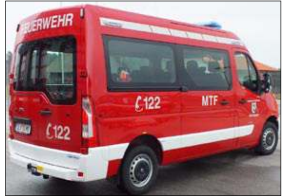
Fahrgestell: Opel Movano Abnahme: 09.04.2013 beim LfV Salzburg