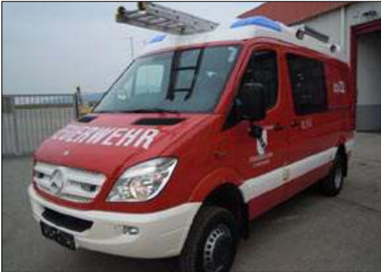
Taktische Bezeichnung: KLFA Aufbaufirma: Rosenbauer