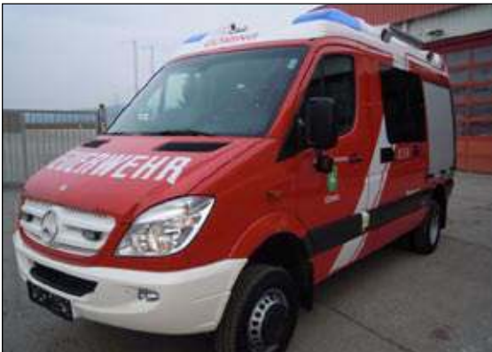
Taktische Bezeichnung: KLFA Aufbaufirma: Rosenbauer