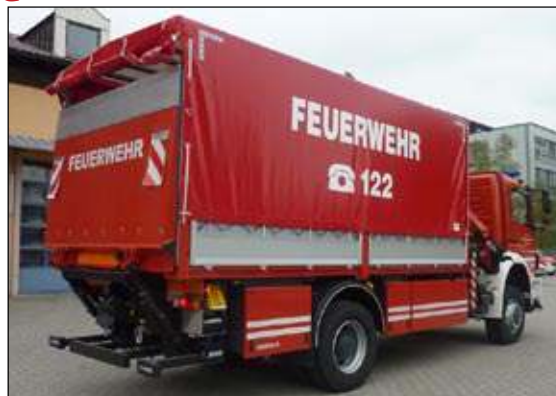
Fahrgestell: Mercedes Benz Axor 1833 4 x 4 Abnahme: 08.04.2013 beim LfV Salzburg