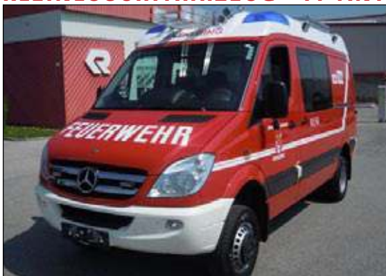
Taktische Bezeichnung: KLFA Aufbaufirma: Rosenbauer