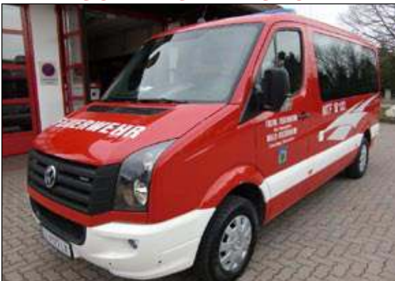
Taktische Bezeichnung: MTF Aufbaufirma: Fa. Lindner / Reischl