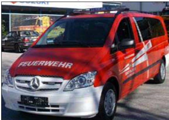
Taktische Bezeichnung: MTF Aufbaufirma: Eberl Salzburg