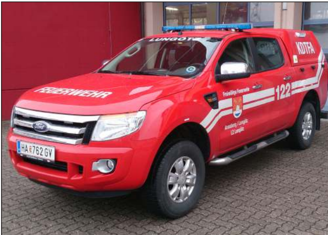
Taktische Bezeichnung: KDTF Aufbaufirma: Lagermax