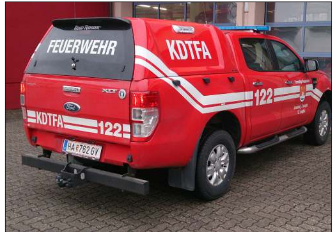
Fahrgestell: Ford Ranger Abnahme: 08.04.2016 im LFV Salzburg