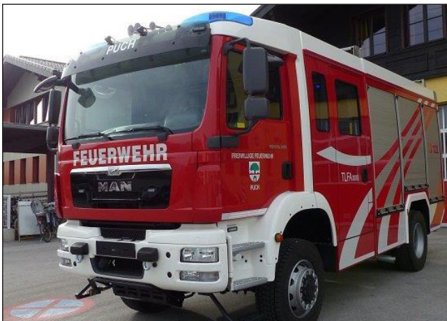
Taktische Bezeichnung: TLFA 3000 Aufbaufirma: Fa. Seiwald