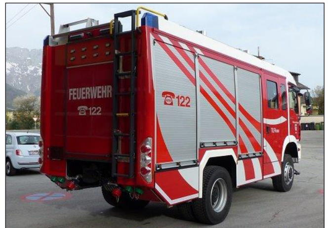
Fahrgestell: MAN TGM 18.340 Abnahme: 13.04.2016 im LFV Salzburg