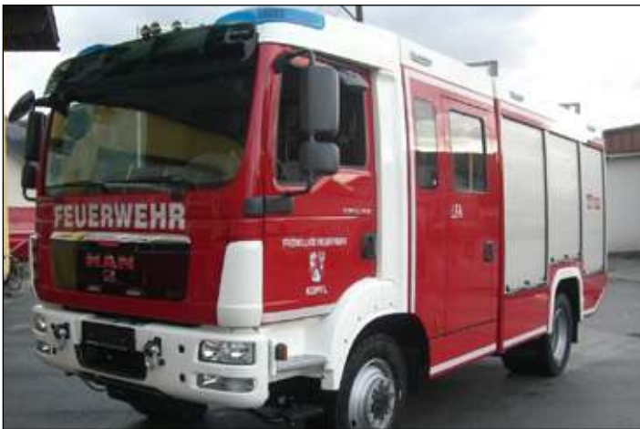
Taktische Bezeichnung: LFA Aufbaufirma: Seiwald