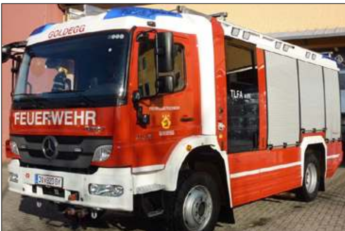
Taktische Bezeichnung: TLFA 4000 Aufbaufirma: Rosenbauer