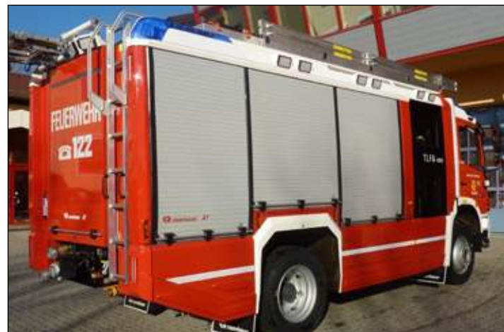
Fahrgestell: Mercedes 1629 AF Abnahme: 12.01.2012 in der LFS Salzburg