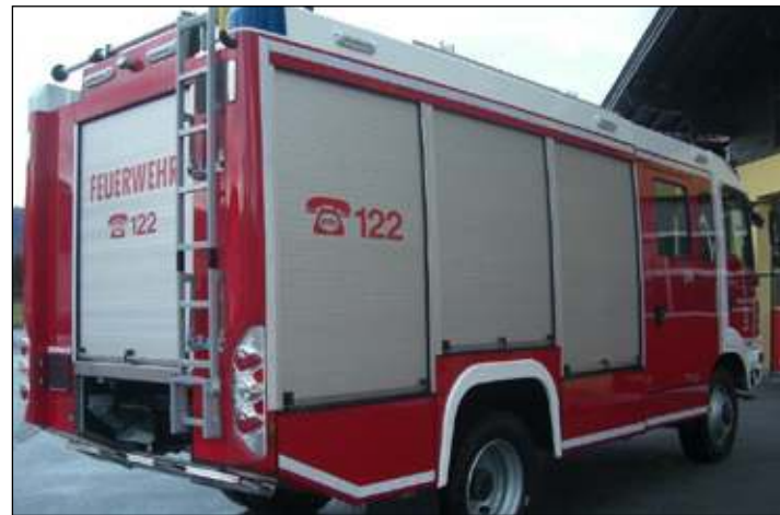
Fahrgestell: MAN 13.250 4 x 4 Abnahme: 11.01.2012 bei der Fa. Seiwald