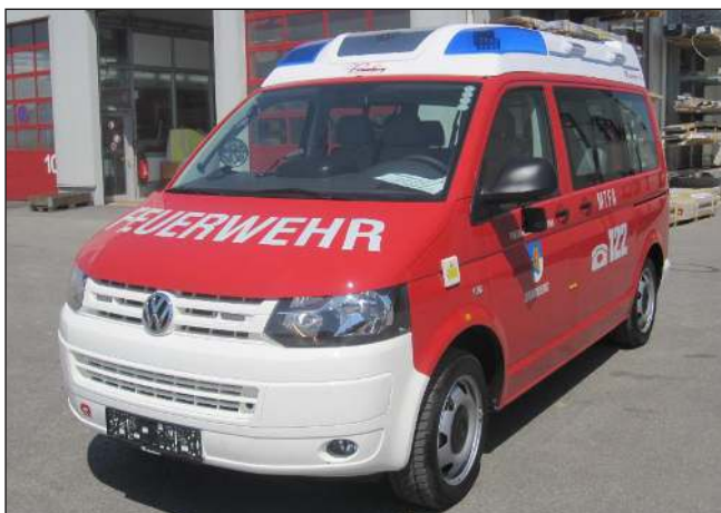
Taktische Bezeichnung: MTFA Aufbaufirma: Rosenbauer