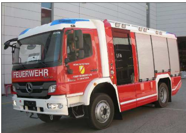
Taktische Bezeichnung: LFA Aufbaufirma: Rosenbauer