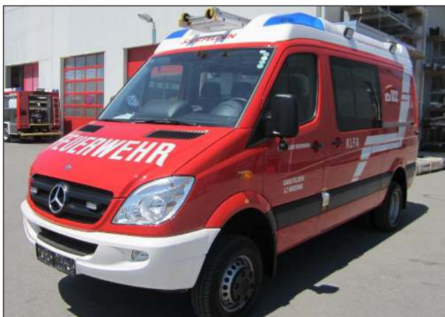
Taktische Bezeichnung: KLFA Aufbaufirma: Rosenbauer