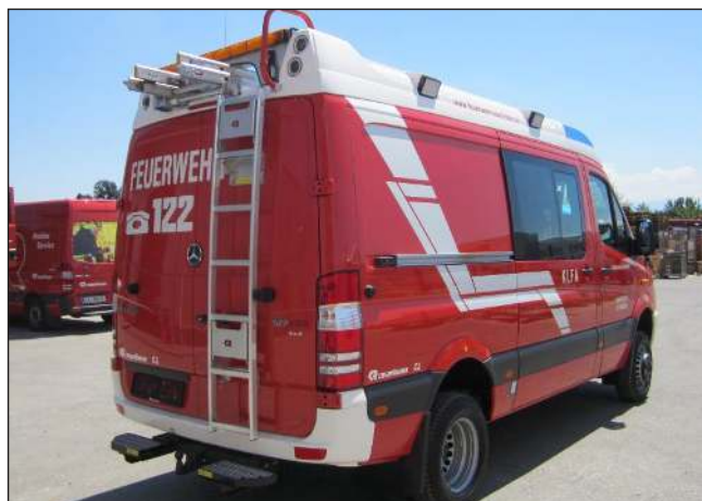
Fahrgestell: Mercedes Sprinter 519 CDI 4 x 4 Abnahme: 19.07.2013 bei der Fa. Rosenbauer