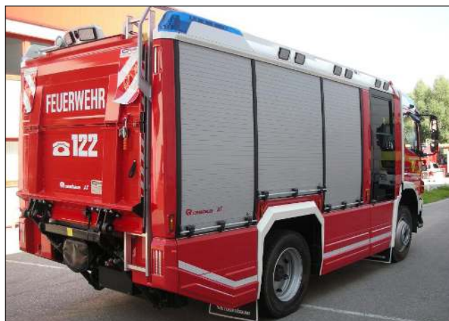
Fahrgestell: Mercedes 1226 AF Abnahme: 19.07.2013 bei der Fa. Rosenbauer