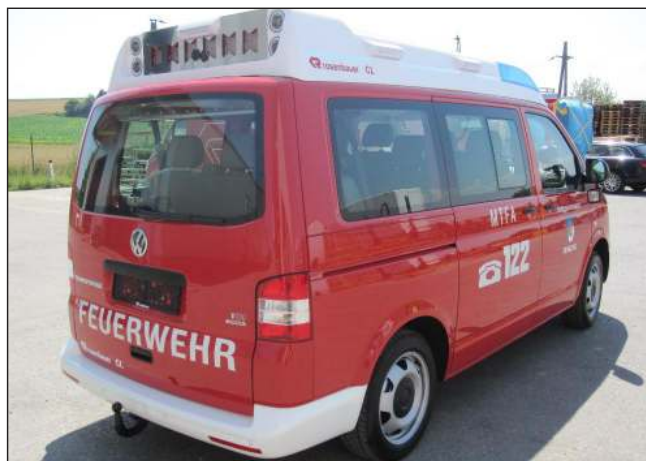
Fahrgestell: VW T5 4 x 4 Abnahme: 31.07.2013 bei der Fa. Rosenbauer