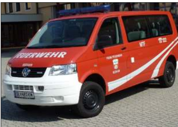
Taktische Bezeichnung: MTF Aufbaufirma: Fa. Seiwald