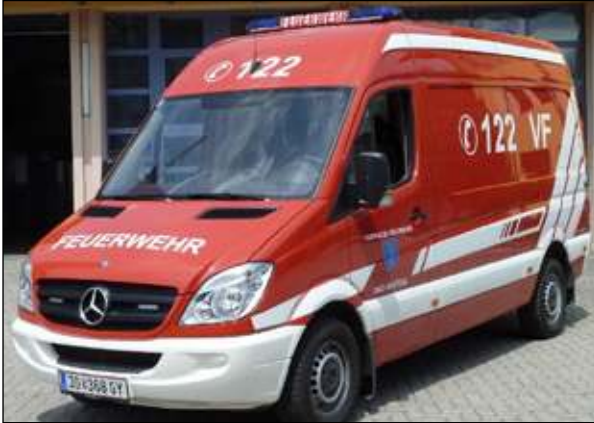
Taktische Bezeichnung: VF Aufbaufirma: Eigenbau