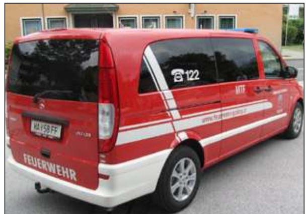
Fahrgestell: MB Vito 111 CDI Abnahme: 07. Juli LFS Salzburg