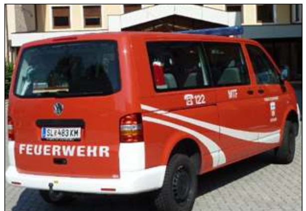
Fahrgestell: VW T5 Abnahme: 07. Juli LFS Salzburg