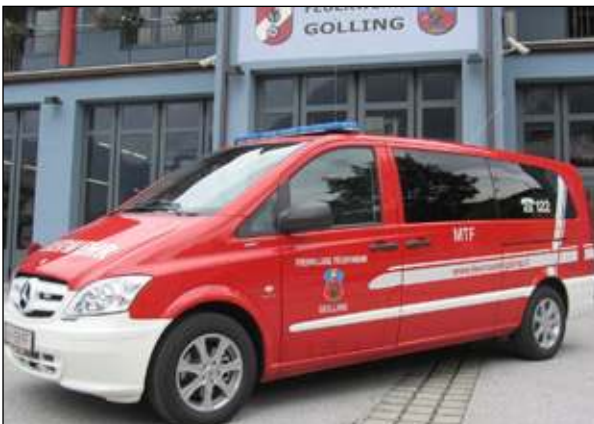
Taktische Bezeichnung: MTF Aufbaufirma: Eigenbau