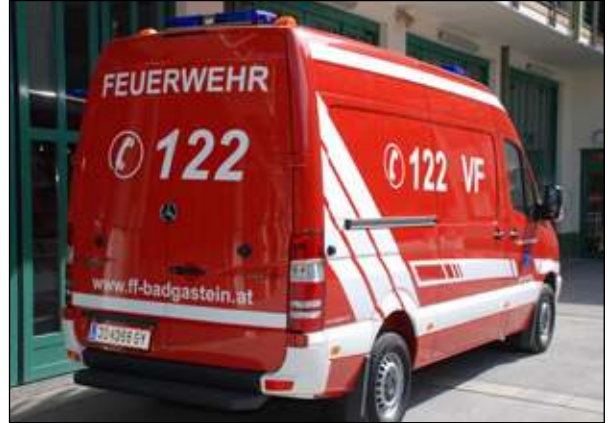
Fahrgestell: MB Sprinter 313 CDI Abnahme: 07. Juli LFS Salzburg