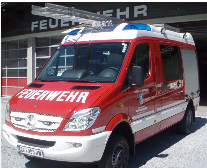
Taktische Bezeichnung: KLFA Aufbaufirma: Rosenbauer