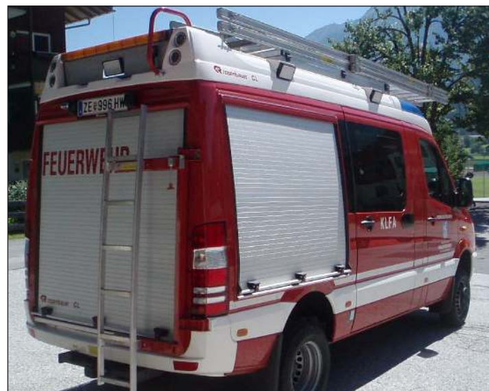
Fahrgestell: Mercedes Sprinter 519 CDI 4x4 Abnahme: 30.07.2012 in der LFS Salzburg