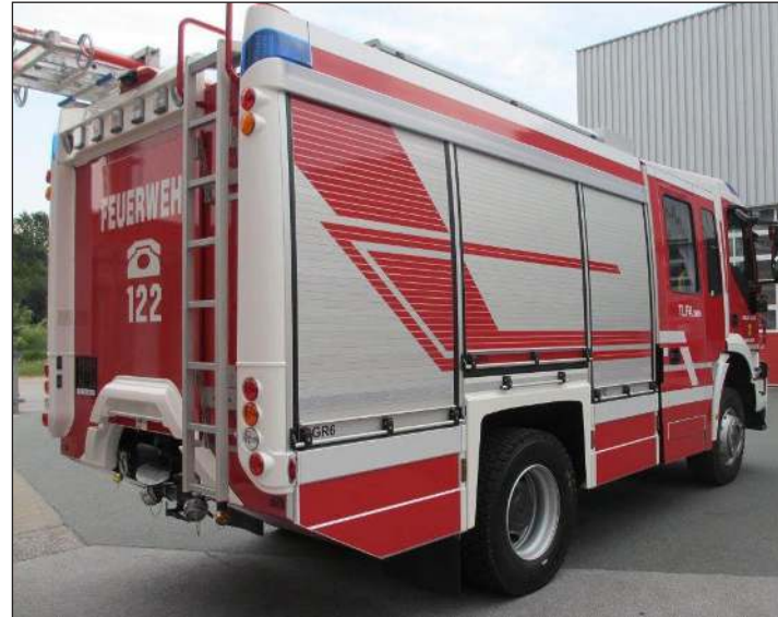
Fahrgestell: Iveco Magirus AD 190T 41 W Abnahme: 18.07.2012 in der LFS Salzburg