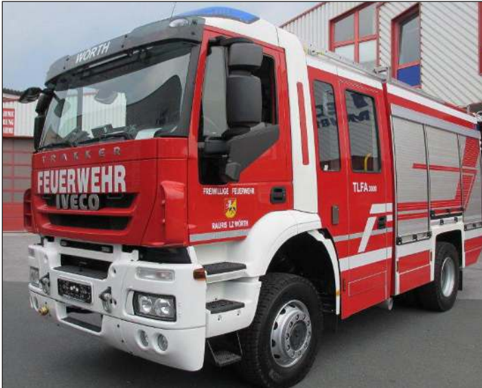
Taktische Bezeichnung: TLFA 3000 Aufbaufirma: Iveco Magirus