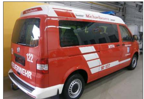
Fahrgestell: VW T5 4 x 4 Abnahme: 25.06.2013 beim LFV Salzburg