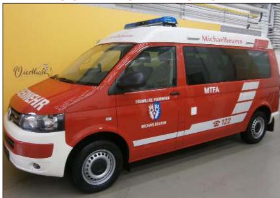
Taktische Bezeichnung: MTFA Aufbaufirma: Fa. Vierthaler