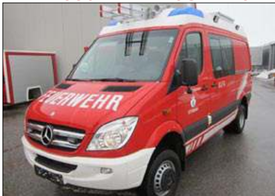
Taktische Bezeichnung: KLFA Aufbaufirma: Rosenbauer