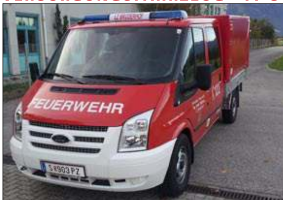
Taktische Bezeichnung: VFA Aufbaufirma: Lagermax / Wuppinger