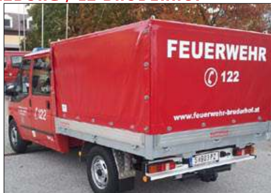
Fahrgestell: Ford Transit Abnahme: 17.10.2012 und 15.03.2013 beim LFV Salzburg