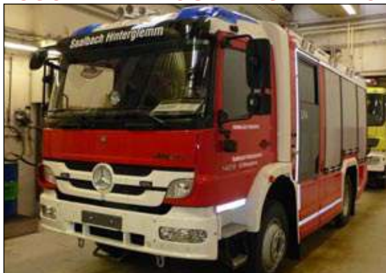
Taktische Bezeichnung: LFA Aufbaufirma: Rosenbauer