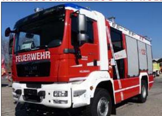
Taktische Bezeichnung: TLFA 3000 Aufbaufirma: Rosenbauer