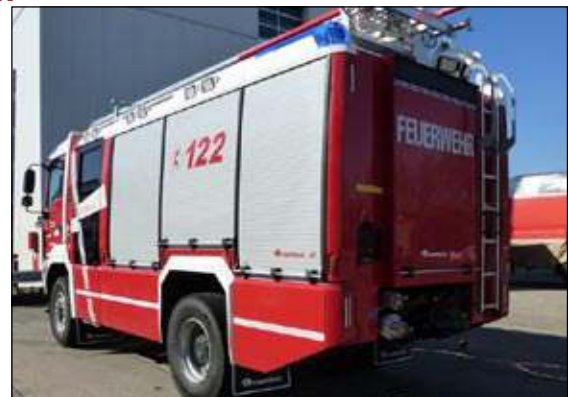
Fahrgestell: MAN 18.340 4 x 4 TGM Abnahme: 06.03.2013 bei der Fa. Rosenbauer