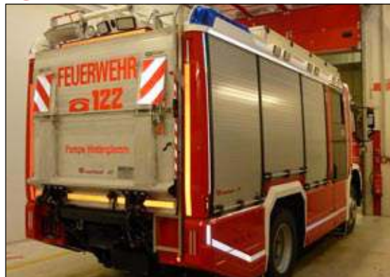
Fahrgestell: Mercedes 1429 AF Abnahme: 15.03.2013 bei der Fa. Rosenbauer