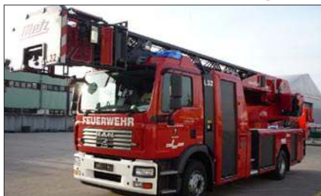
Taktische Bezeichnung: DLA (K) 23-12 Aufbaufirma: Metz / Rosenbauer