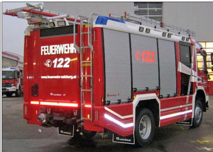
Fahrgestell: Mercedes 1629 AF Abnahme: 29.11.2012 bei der Fa. Rosenbauer