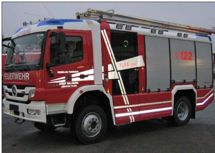
Taktische Bezeichnung: TLFA 3000 Aufbaufirma: Rosenbauer