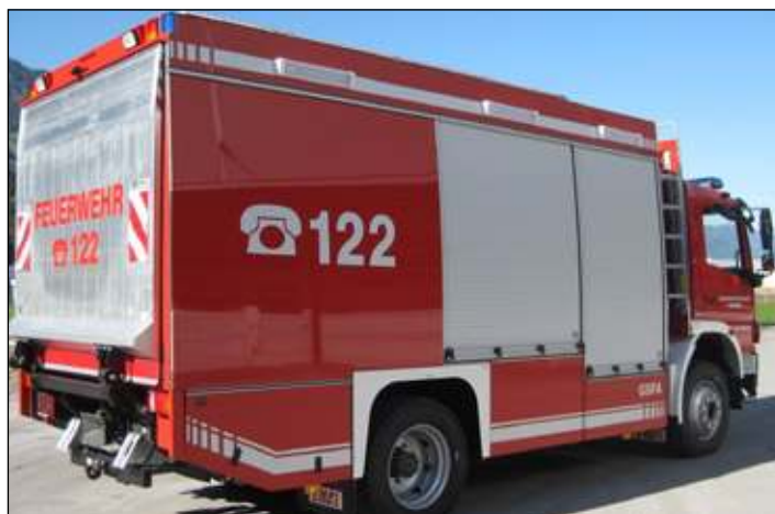
Fahrgestell: Mercedes Atego 1226 AF Abnahme: 10.10.2011 bei der Fa. Empl