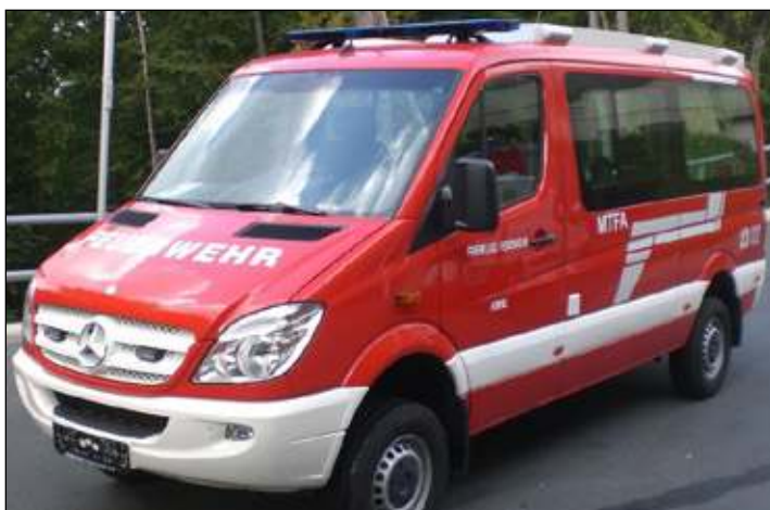
Taktische Bezeichnung: MTFA Aufbaufirma: Iveco Magirus