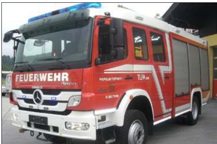
Taktische Bezeichnung: TLFA 3000 Aufbaufirma: Seiwald