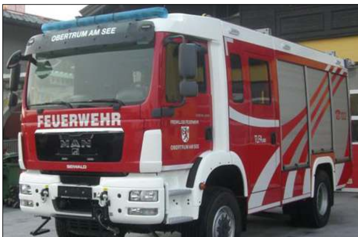
Taktische Bezeichnung: TLFA 3000 Aufbaufirma: Seiwald