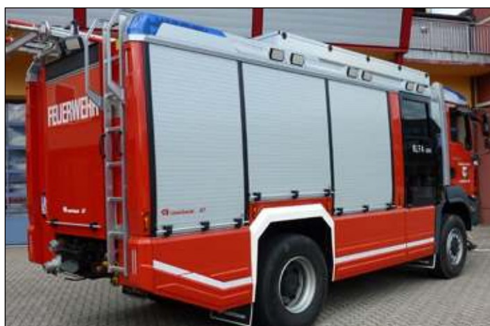
Fahrgestell: MAN TGM 18.340 Abnahme: 10.10.2011 bei der Fa. Rosenbauer