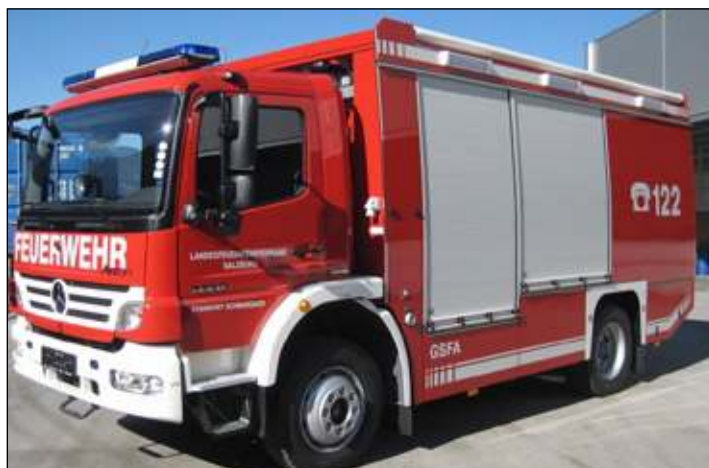
Taktische Bezeichnung: GSFA Aufbaufirma: Empl