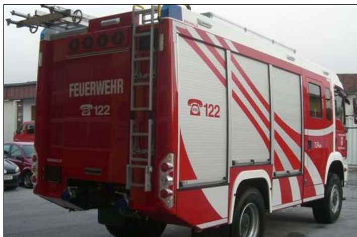
Fahrgestell: MAN TGM 18.340 Abnahme: 20.10.2011 bei der Fa. Seiwald