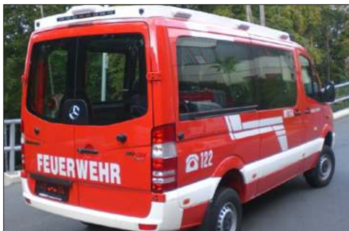
Fahrgestell: Mercedes Sprinter 319 CDI Abnahme: 29.09.2011 in der LFS Salzburg