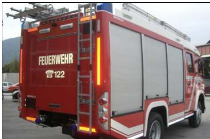
Fahrgestell: Mercedes 1629 AF Abnahme: 26.09.2011 bei der Fa. Seiwald