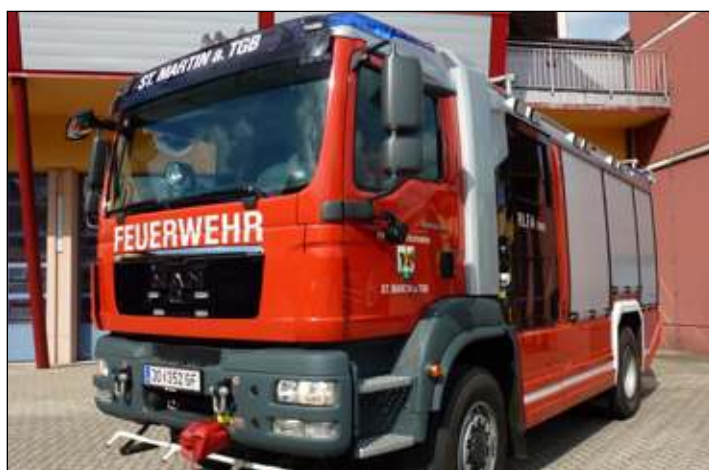
Taktische Bezeichnung: RLFA 3000 Aufbaufirma: Rosenbauer